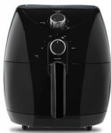
Imagen del producto participante.

Abran 15 ganadores del concurso, cada uno de los ganadores del sorteo recibirá un “Air Fryer” marca Oster, modelo: CKSTAF7601 con capacidad de 2,3 litros.