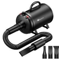
Secador de mascotas 5.2 HP/3800W para aseo de mascotas. 1 unidad disponible