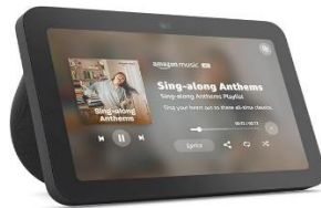
Amazon Echo Show con audio espacial. 1 unidad disponible