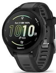
Garmin Forerunner 165, reloj inteligente para correr. 1 unidad disponible